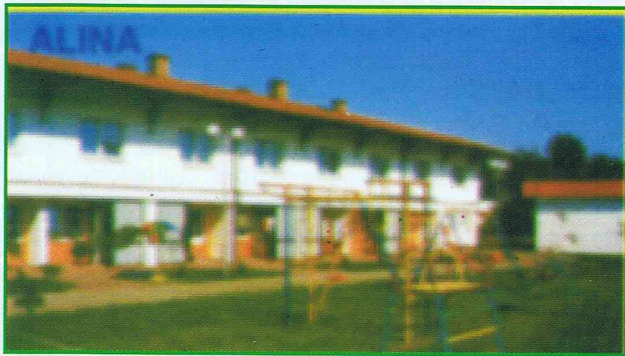
W takich domach byli zakwaterowani Delegaci

W trzecim dniu obrad zatwierdzono skład Prezydium Rady Krajowej, wybrano Radę Krajową oraz Krajową Komisję Rewizyjną i Komisję Statutową. W tym dniu rozpatrywano również wnioski.