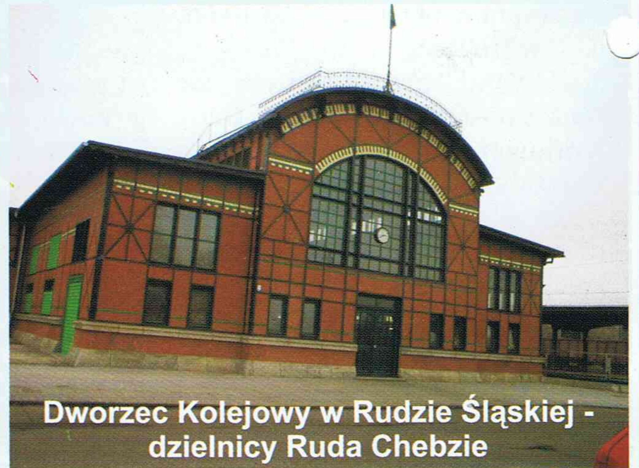
Dworzec Kolejowy w Rudzie Śląskiej - dzielnicy Ruda Chebzie