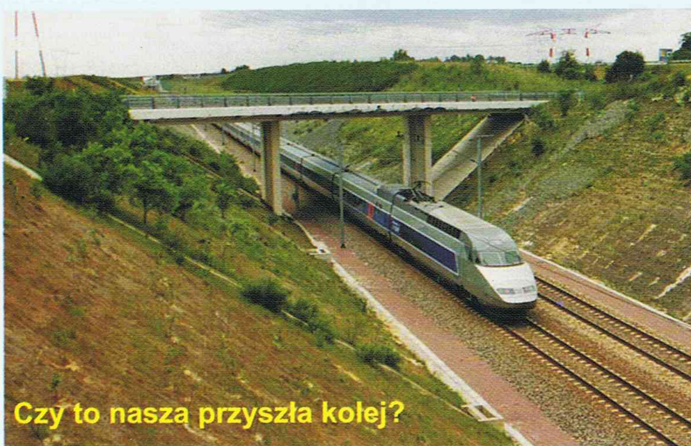
Czy to nasza przyszła kolej?

będzie służył interesom polskiej gospodarki. Jak najszybciej należałoby ratować polską kolej, pozostaje tylko pytanie kiedy parlamentarzyści i rządzący zrozumieją, że kolej leżąca w środku Europy daje ogromne możliwości rozwoju kraju. Transport kolejowy mógłby stanowić jeden z ważniejszych atutów naszej gospodarki po wejściu do UE. Wynika to z naturalnych walorów położenia geograficznego, kolej może stanowić bazę techniczną przemysłu kolejowego krajów UE oraz niebagatelny walor bezpieczeństwa i ekologia a transport kolejowy jest bezpieczny i ekologiczny.